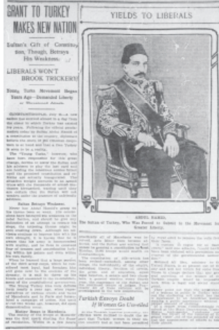
26 July 1908, The Washington Times, s.3.

Ele alınan konuyla ilgili Amerikan basınında yer alan haberler genellikle yalın bir şekilde verilmiş, bazı haberler ise etkili yorumlarla desteklenmiştir. Osmanlı coğrafyasında yaşanan bir siyasal dönüşüm hamlesinin Amerikan basınına yansımaları ve geniş bir perspektifte değerlendirilmesi ilgi uyandırıcı düzeydedir.