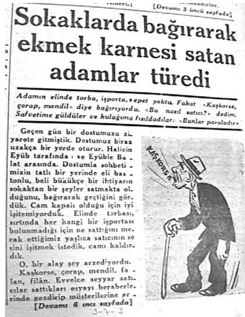
Resim 6: Ekmek karnesi satıcısı