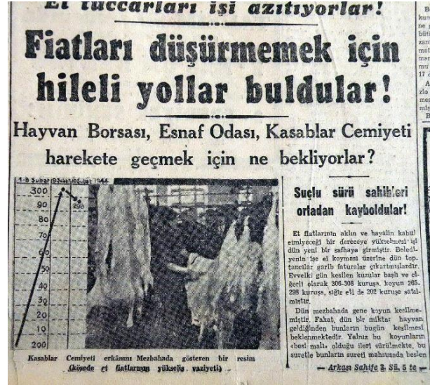
Kaynak: Akşam, 10 Şubat 1943, sayı:8730

Et fiyatlarının yükselmeğe devam etmesi karşısında celepler, bu yükselişin hayvan gelmemekten ileri geldiğini iddia ediyorlardı. Oysa karamanın kilosu 280, kıvırcık 285, sığır