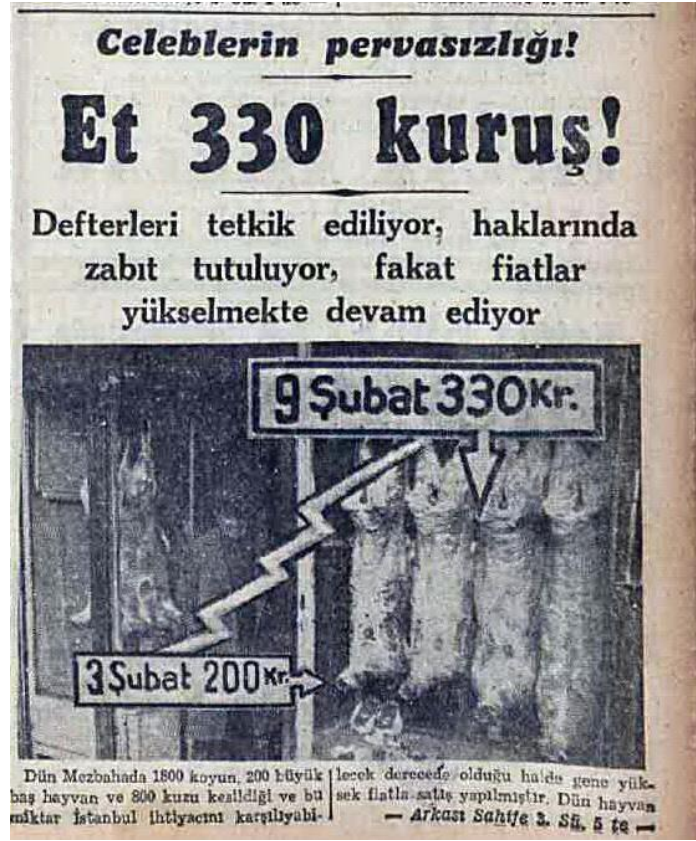
Kaynak: Cumhuriyet, 10 Şubat 1944, sayı:6999