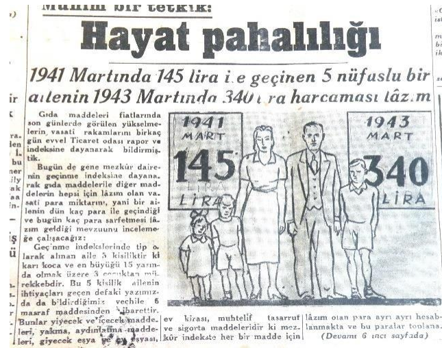
Resim 4: Hayat pahalılığı endeksi