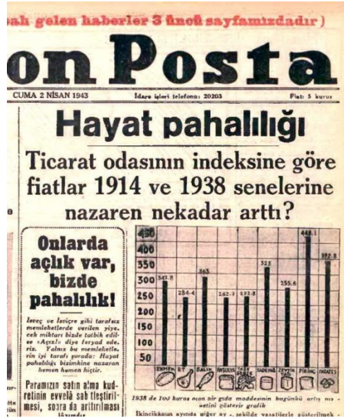
Resim 1: Hayat pahalılığı