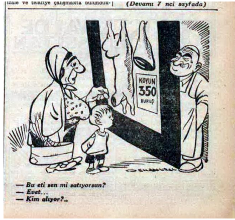
Resim 8: Kasap vitrini